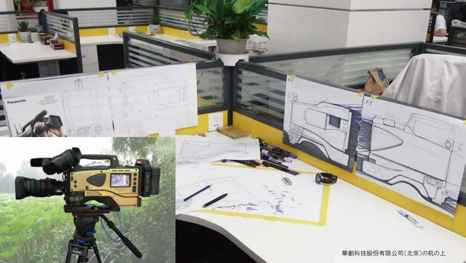
華創科技股份有限公司(北京)の机の上