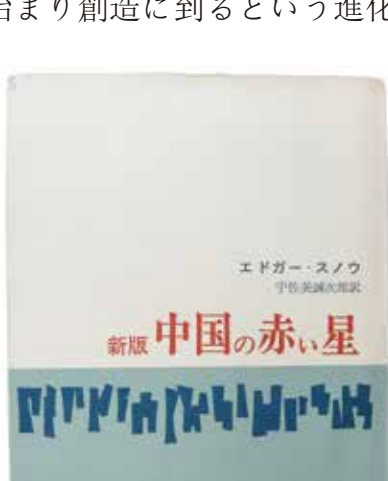
エドガー・スノウの代表作 1952年初版 1962年新版